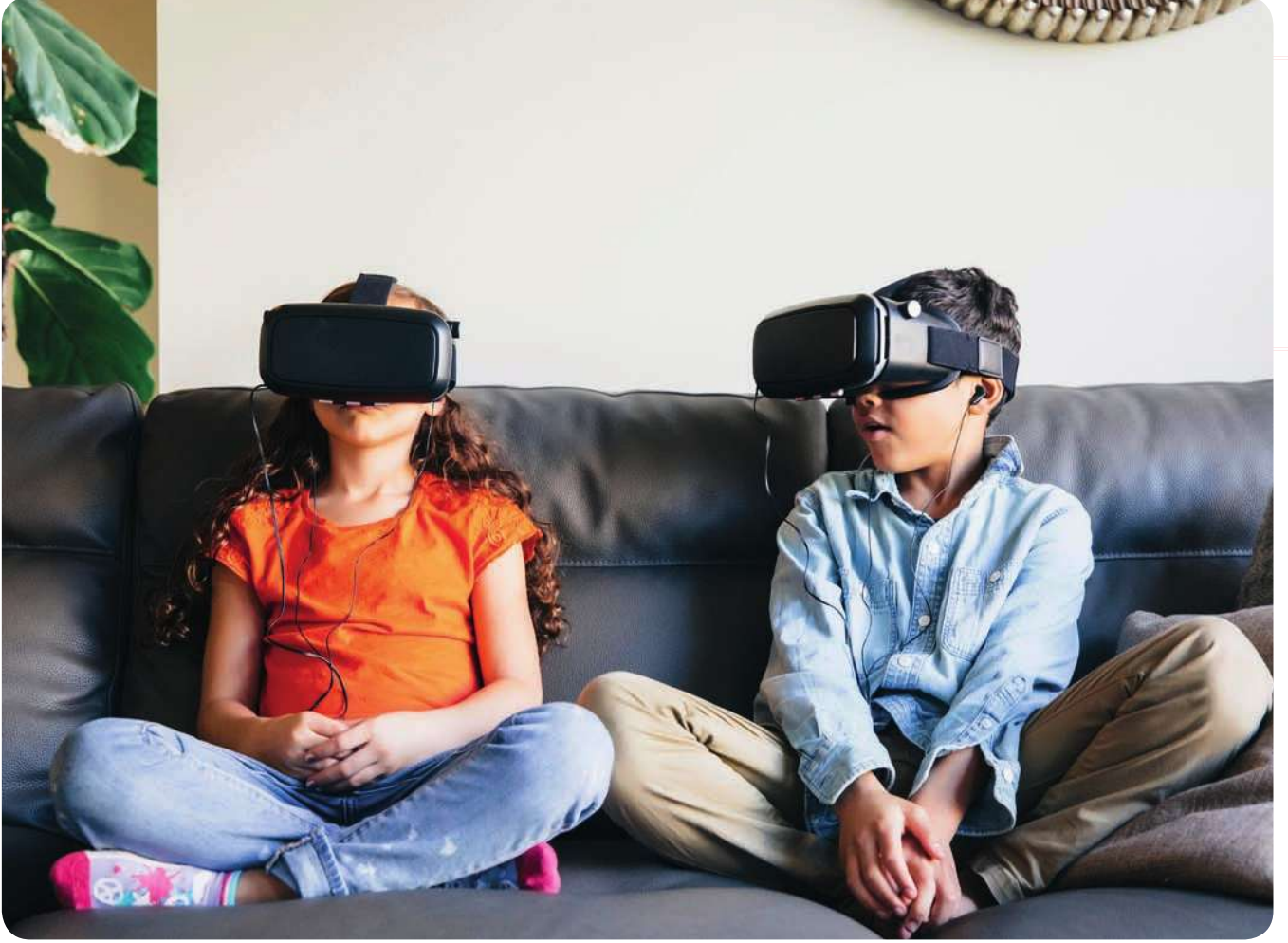
أطفال يشاهدون أحد أفلام الواقع الافتراضي