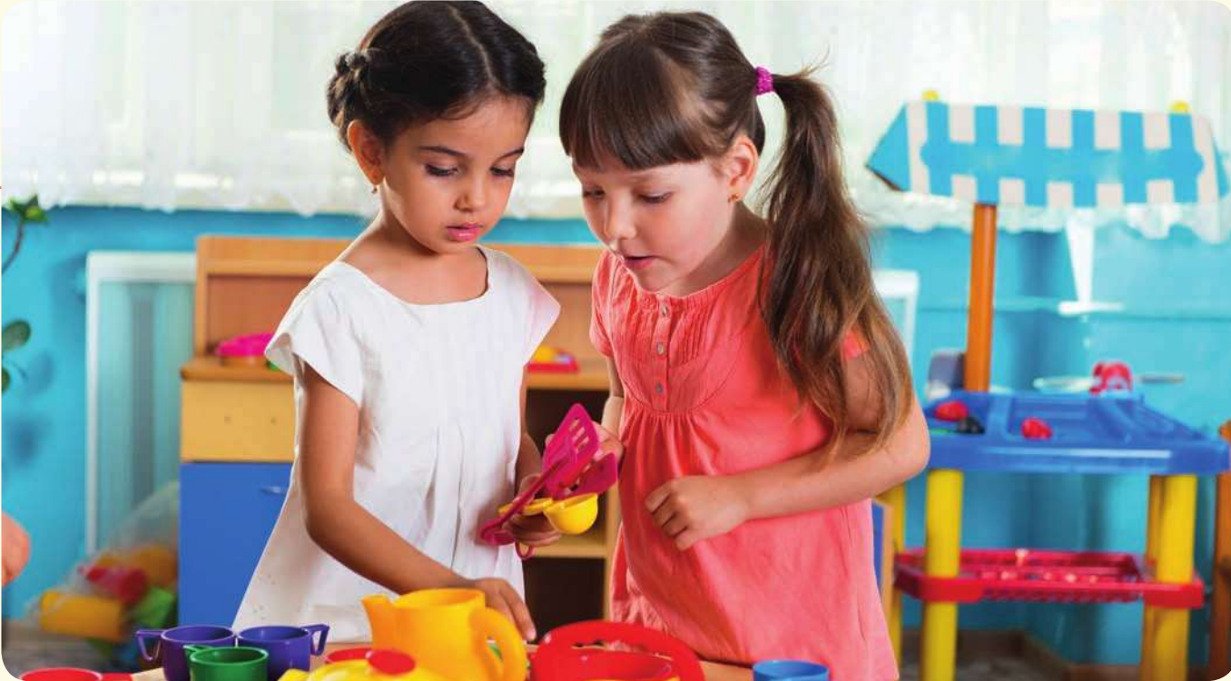
ندين وصديقتها تلعبان بالعباب المفضلة

- آسف يا صديقي، لا أستطيع أن أذهب باكراً إلى النادي. لقد وعدت والدي أن أوصول أختي إلى منزل صديقتها لأن والدي لا يستطيع إصالتها.