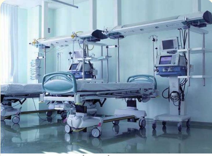
إِخْدَى غُرْفِ الْعِنَايَةِ الْخَرِجَةِ

ب. أَعْلَنَ الْمُؤْتَمَرُ الثَّالِثُ عَشَرَ لِلْعِنَايَةِ