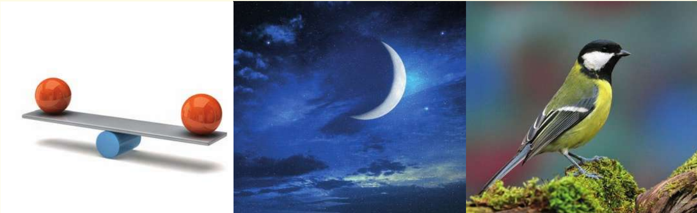
أعضاء مجموعة العصفور والقمر والميزان

تبادل الأدوار مع زملائك في المجموعة كي تلعب جميع الأدوار. أي دور أعجبك أكثر؟