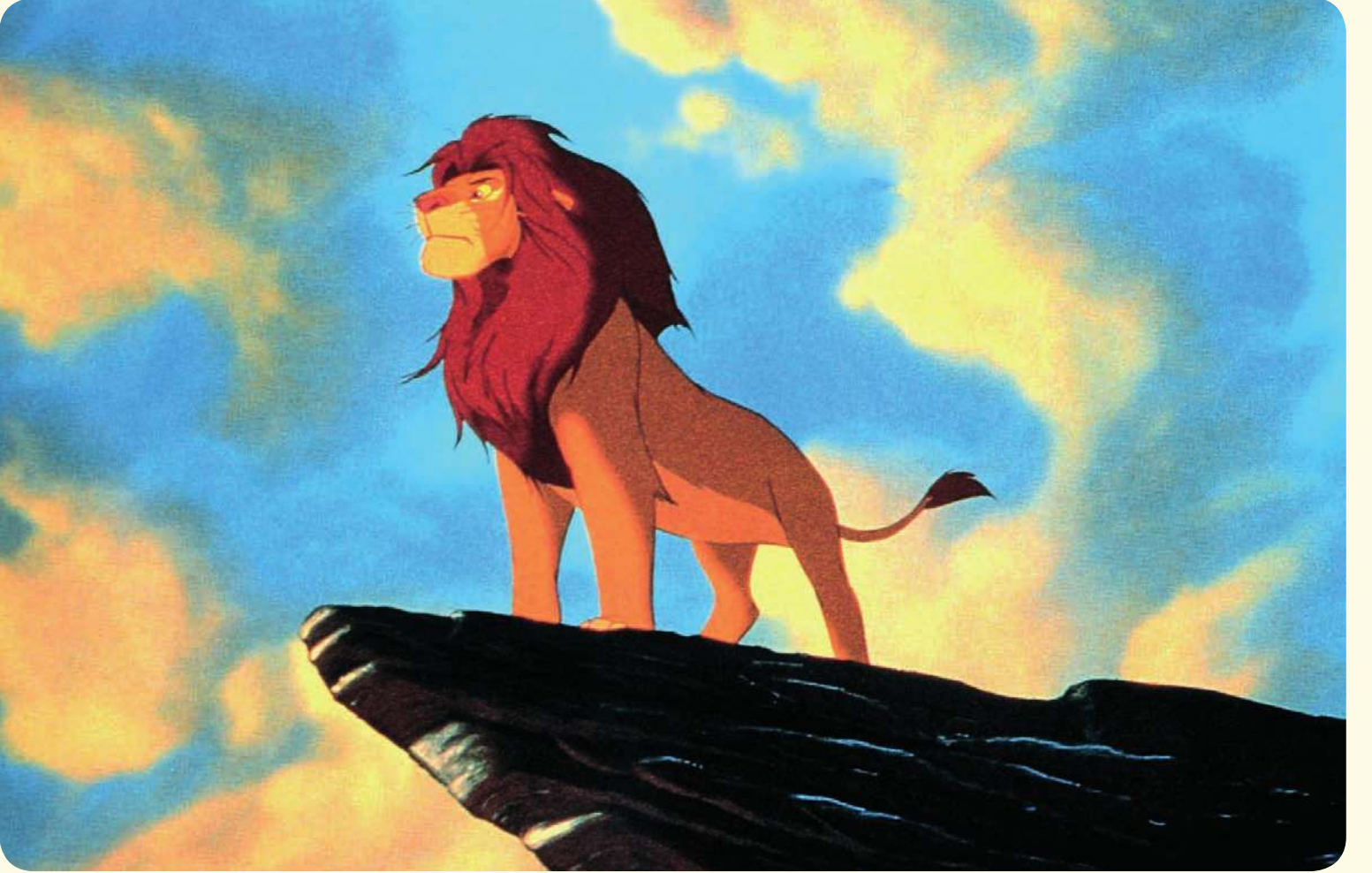
سيمبا "الأسد المليك"

ب. استنتج العوامل التي تؤدي بالقائد إلى تحقيق النصر: